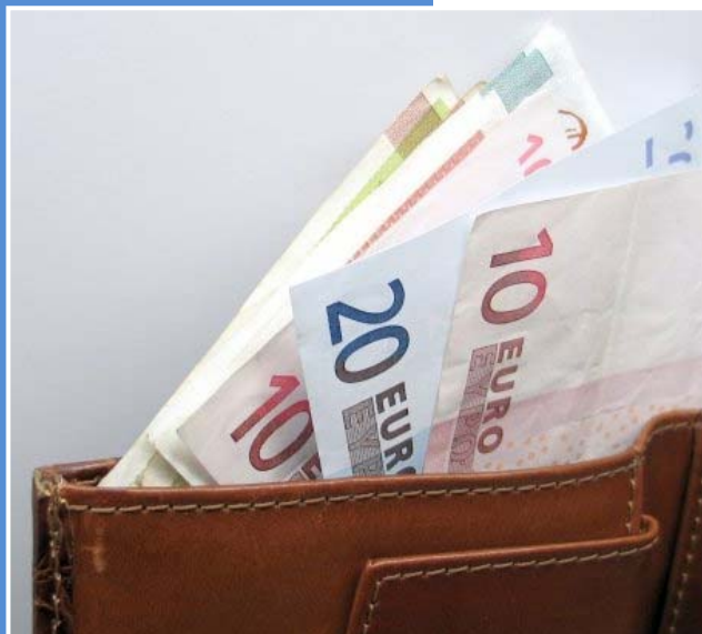
Gerade Geringverdiener profitieren vom Sozialausgleich